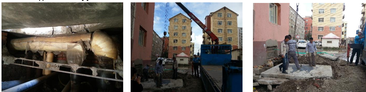
(зураг-4) Хучилтын хавтан цөмөрсөнийг шинээр сольж буй байдал

Тус хотхоныг дулааны эрчим хүчээр хангах төвийн 1 дүгээр шугамаас хэрэглэгч рүү дулаан дамжуулах 2 дугаар хэлхээнд дулааны эрчим хүч дамжуулах шугамын ф/200-ын хаалт-1 ширхэг, ф/150-ын 2 ширхэг хаалтууд техникийн шаардлага хангахгүй болсон тул дээрх хаалтуудыг салгаж шинээр хаалт тавих, хучилтын хавтан нь цөмрөлт өгч шугамаа дарсан байсныг шинээр сольж тавих дулааны шугам хоолой, худагт хуримтлагдсан хог шороог цэвэрлэн гаргаж, засвар үйлчилгээг 2017 оны 08 дугаар сарын 02-05 өдрүүдэд хийж өвөлжилтийн бэлтгэл ажлыг бүрэн хангуулсан.