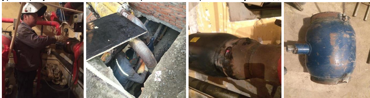
(Зураг-5) узель доторх ф-200-ийн хаалтыг шинээр сольж гагнаж тавьсан байдал